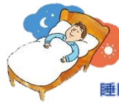
睡眠段階と眠りの程度